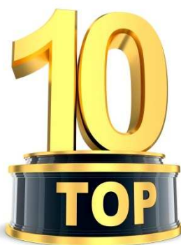
Olga Zelika Detective